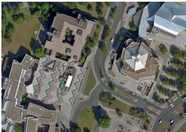
Volle Interaktion und BI-Analysemöglichkeiten - von der globalen Marktsicht bis zum Einzelobjekt in aktuellen Luftbildern.

BGI Analytics wird mit Modulen für die Branchen Energieversorgung, Handel, Industrie, Automotive und Financial ausgeliefert. Dabei werden Ihre speziellen Anforderungen und Arbeitsprozesse bereits abgebildet. Als BGI „Customer Analytics“ ist es für das regionale Zielgruppenmarketing und effiziente Kundenmanagement einsetzbar. Als „Grid Analytics“ beinhaltet es die Möglichkeit, Leitungsnetze aus GIS und CAD zu integrieren und mit den Vertragsdaten aus SAP zu verknüpfen.